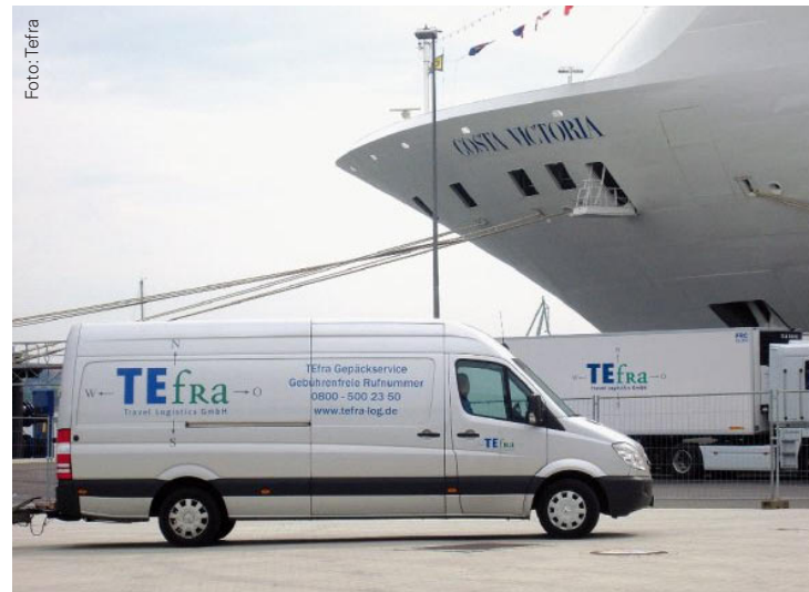
Tefra Travel Logistics ist auch in der Hochseekreuzfahrt ein gefragter Gepäckdienstleister